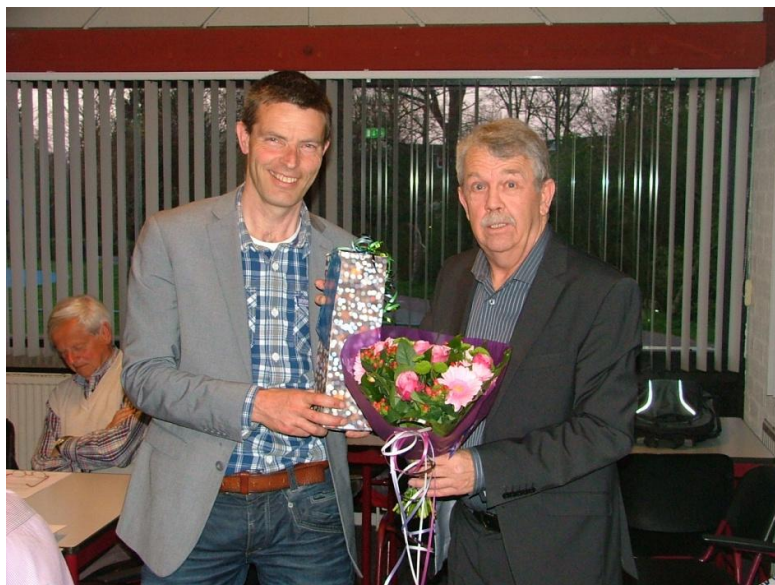
De voorzitter overhandigt cadeaus aan de penningmeester